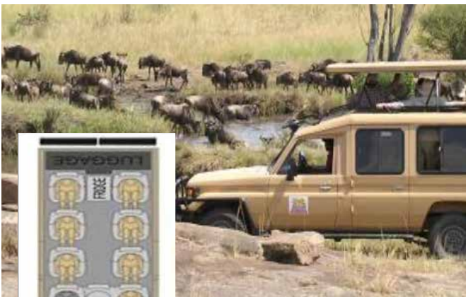
Vehicules utilisés pour le Safari

Dîner ou panier pique-nique suivant les horaires de votre vol.